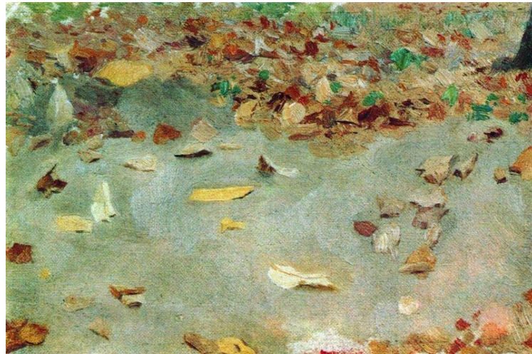
Осенние листья. Этюд для картины «Осенний день. Сокольники»