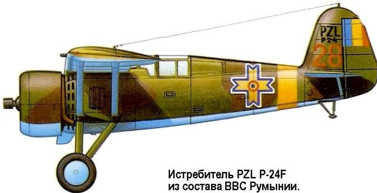
Истребитель PZL P-24F из состава ВВС Румынии.