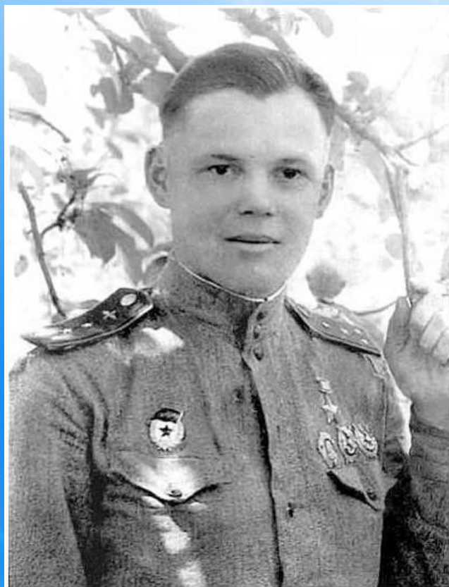
Г.А. Речкалов в период боев на Кубани был командиром звена в эскадрилье А.И. Покрышкина. За апрель и май сбил 15 немецких самолетов, и одним из первых в полку получил звание ГСС. Лето 1943 г.

Дважды Герой Советского Союза, лётчик-ас времён Великой Отечественной войны, генерал-майор авиации.