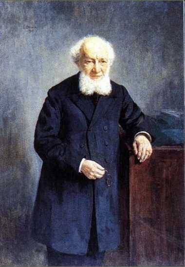
П. П. Семёнов-Тян-Шанский.