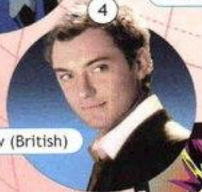
Jude Law (British)