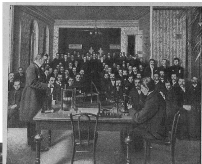
ГРУППА ПОСЕТИТЕЛЕЙ ОБЩЕСТВА «МАЯКЪ» на лекции физики съ опытами.

Руководители Общества говорили про свою организацию, что она «представляет из себя для скучающих - клуб с полезными, приятными и нравственными средствами времяпрепровождения, для одиноких - домашний уют и товарищескую семью, для ищущих знаний - неисчерпаемый источник их, для слабых физически - место укрепления здоровья, для слабых духовно - источник бодрости и нравственного самосовершенствования». Общество первым в истории новой России, организовывало поиск работы для молодёжи.