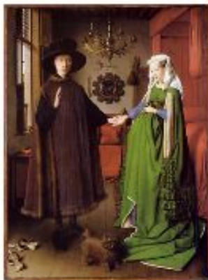
Ян ван Эйк Портрет четы Арнольфина