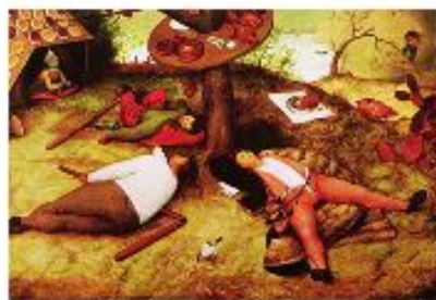
Питер Брейгель Старший. Страна лентяев