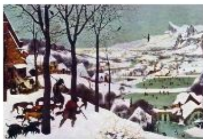
Питер Брейгель Старший. Охотники на снегу