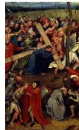
Босх. Несение креста