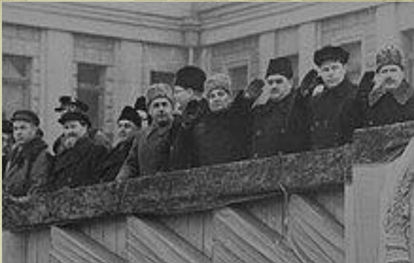
Члены правительства СССР на трибуне