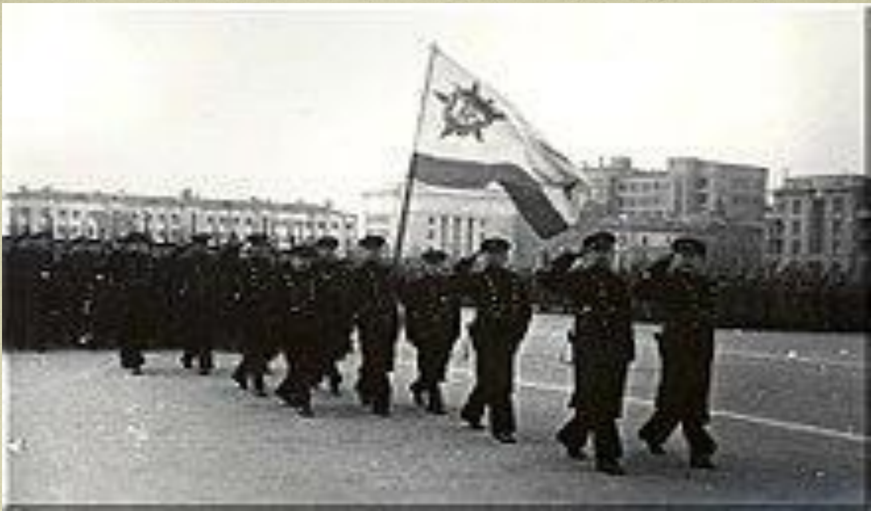
Моряки Амурской флотилии