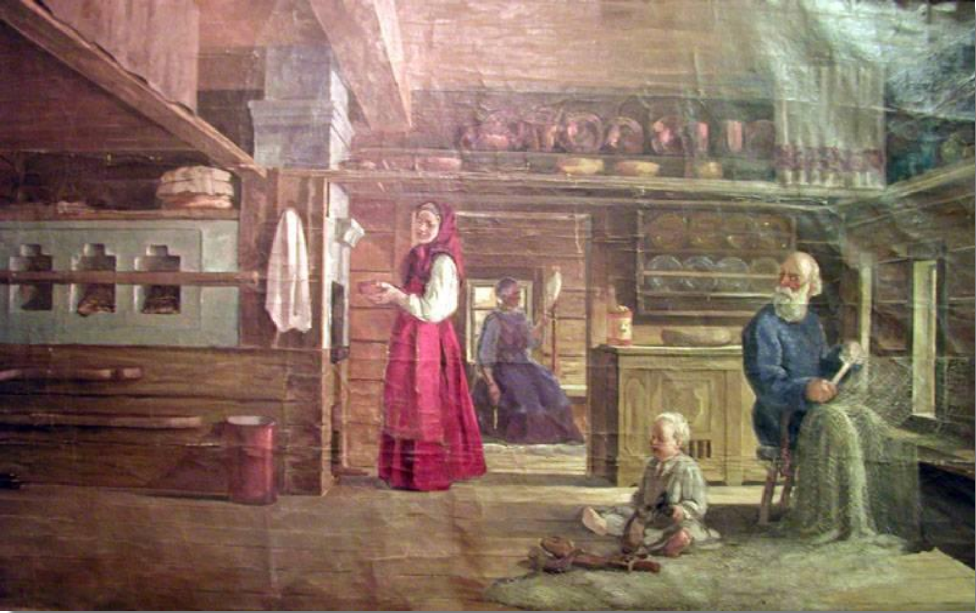
О.Качаров «Поморская семья»