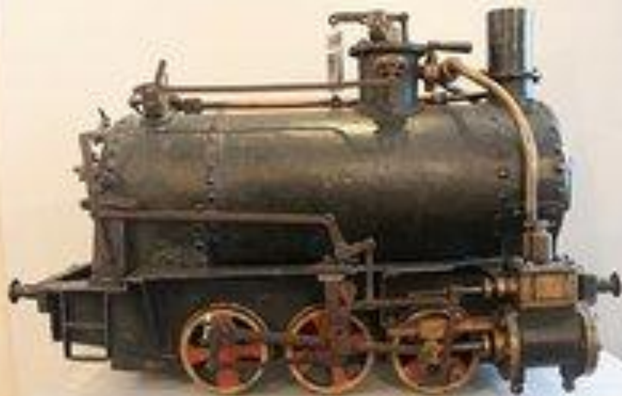
Model of a steam locomotive engine, likely a portable engine, displayed on a white pedestal. The engine is dark, possibly black or dark brown, with prominent brass or copper-colored wheels and connecting rods. It features a large horizontal boiler, a tall chimney stack at the rear, and various mechanical components like the cylinder, piston, and valves. The model is set against a plain, light-colored background.