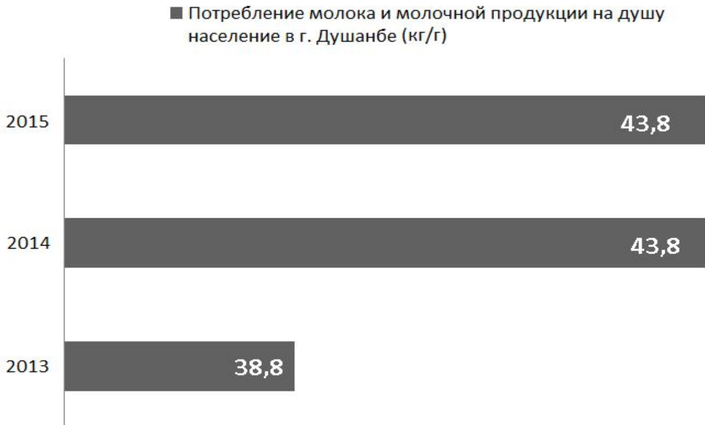
Рис. 2. Среднегодовое потребление молока и молочных продуктов на одного человека в г. Душанбе (кг)