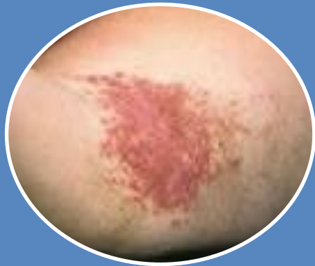
Терінің шыршыты қабатының беткей кандидозы