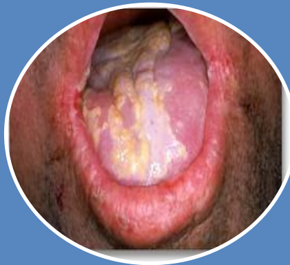
Балалардың созылмалы гранумматозды кандидоз.