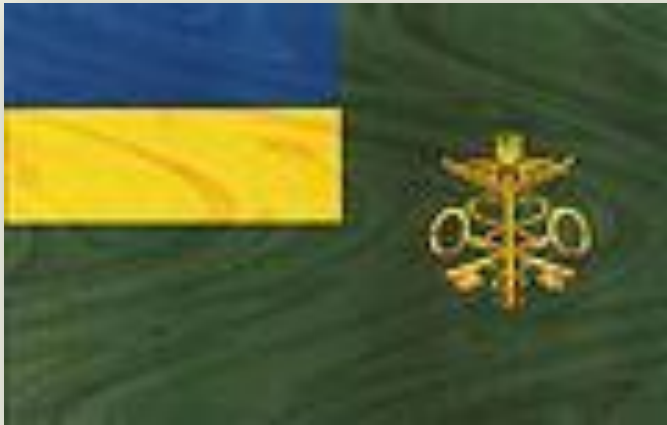
Прапор Державної митної служби України