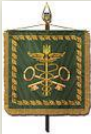
Штандарт Голови Державної митної служби України