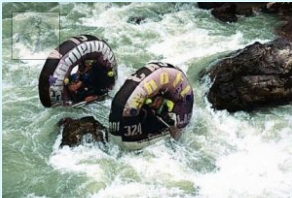
Бублик или Карабубер

Это судно для прохождения наиболее сложных рек. Основное его достоинство в том, что оно имеет огромную устойчивость и даже в случае переворота самостоятельно возвращается в нормальное положение. Обеспечивается это следующей конструкцией: два надувных поплавка в форме бублика, соединяются каркасом (металлическим или деревянным)