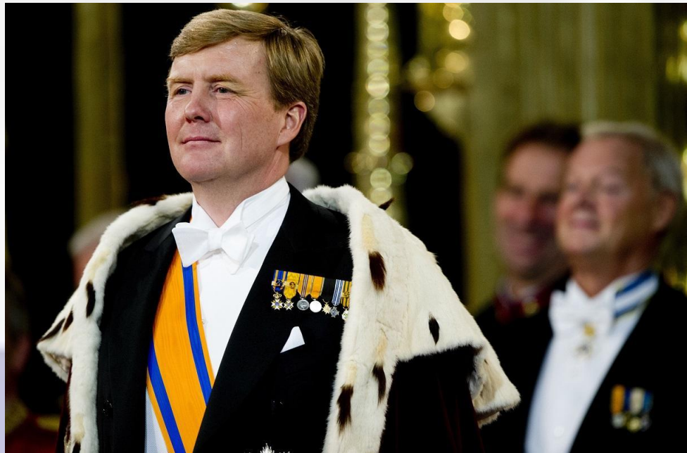
Король Виллем- Александр