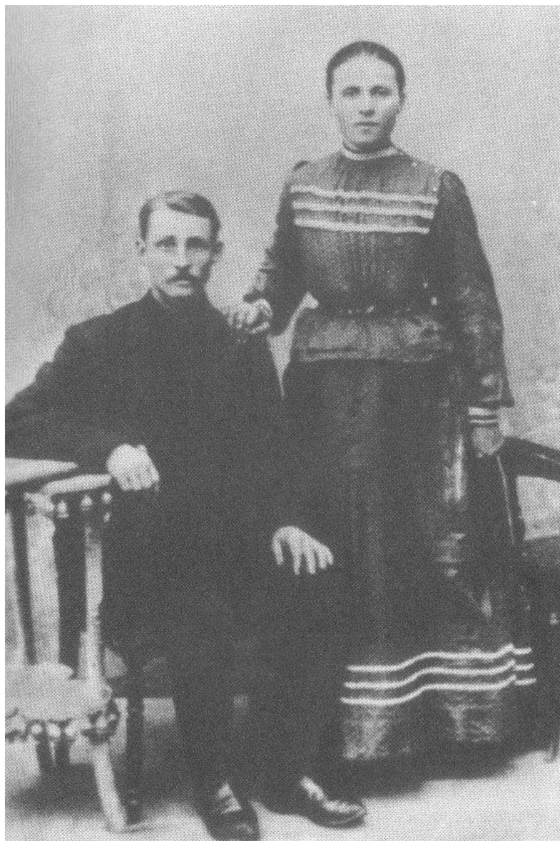
Родители поэта - потомственные рязанские хлеборобы