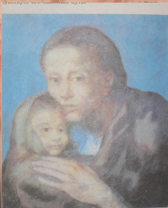
ПИКАССО. Мать и дитя. Масло

И в наши дни художники разных народов создают об этом свои произведения.