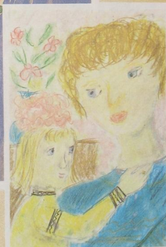
ДЕТСКИЕ РАБОТЫ. Гуашь, мелки