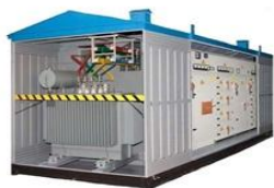
Комплектные Трансформаторные Подстанции (КТП)