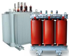
Силовые трансформаторы масляные и сухие (ТМГ11, ТСЗГЛ, Trihal, Legrand, Geafol)