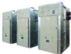
Распределительные устройства на 6-10 кВ (КСО и КРУ)