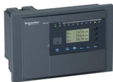
Микропроцессорные устройства релейной защиты, выключатели вакуумные и элегазовые до 20 кВ