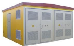
Блочные Трансформаторные Подстанции (БТП)