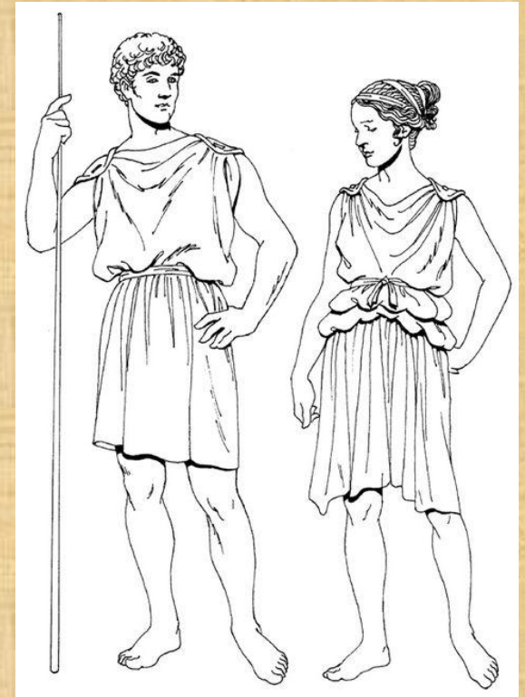
Хитон – греческая одежда