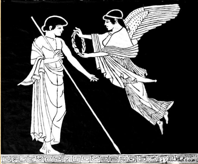
Вручение оливкового венка

Выиграть олимпиаду было большой честью как для атлета, так и для полиса, который он представлял. Победителей часто освобождали от всех повинностей и давали разные привелегии. Трехкратному победителю устанавливали статую в Олимпии.