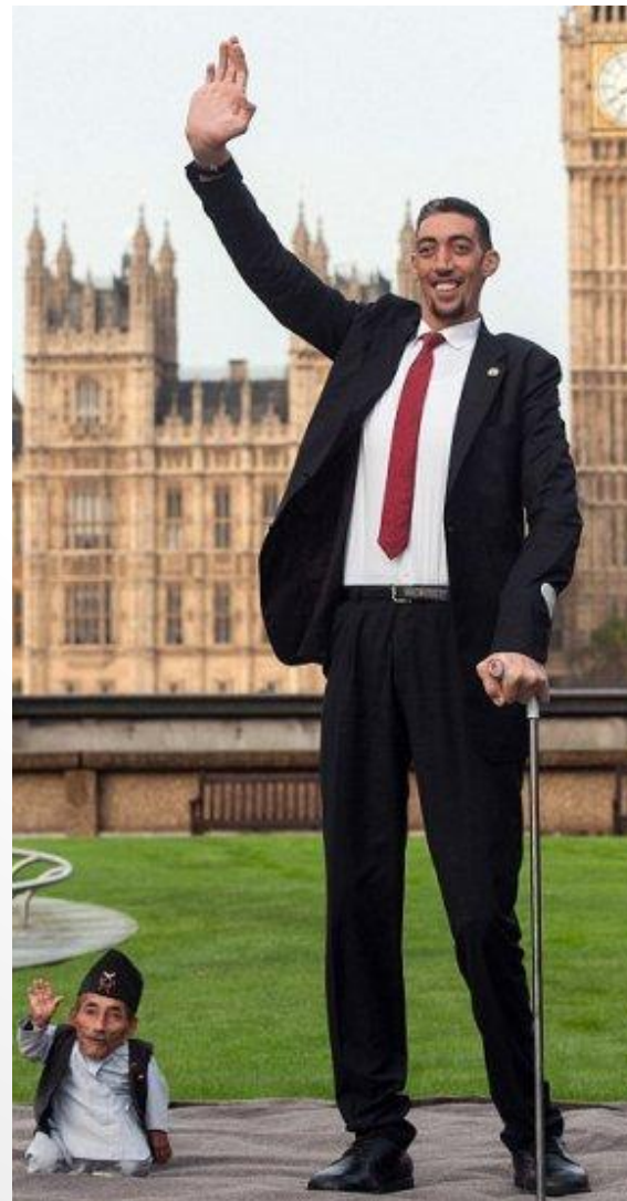
карликовость и гигантизм