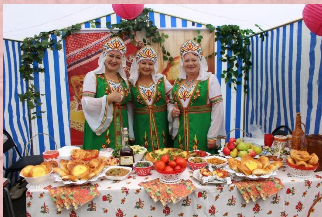
Районный фестиваль летней кухни «ВкусФест» 16 августа п. Ромоданово