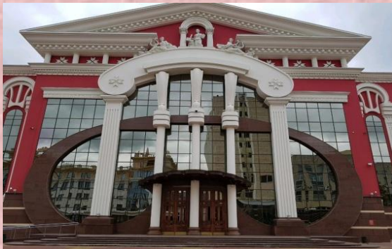
85-летие Государственного музыкального театра им. И.М. Яушева 1 ноября