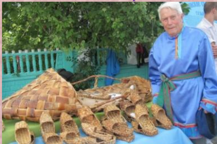
Традиционный праздник лаптя «ЭРЗЯНЬ КАРТЬ» Большеберезниковский р., с. Дягилёвка