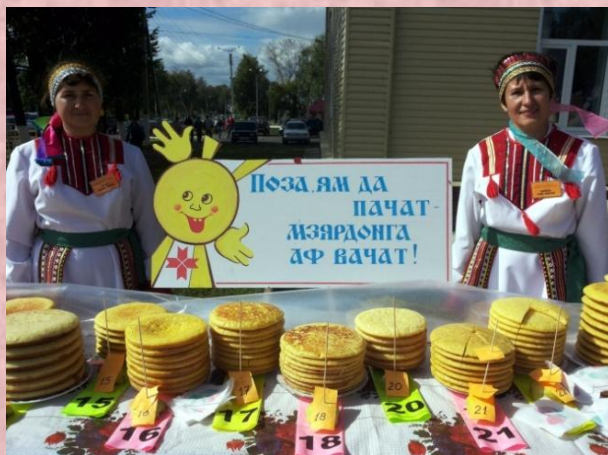
Гастрономический фестиваль ПРАЗДНИК БЛИНА с. Атюрьево