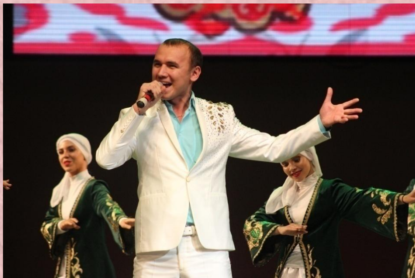
Республиканский фестиваль-конкурс татарской песни «АВЫЛЫМ ТАВЫШЛАРЫ» (Родные напевы) 19 сентября