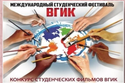
Конкурс студенческих фильмов ВГИК 16, 18, 20 ноября