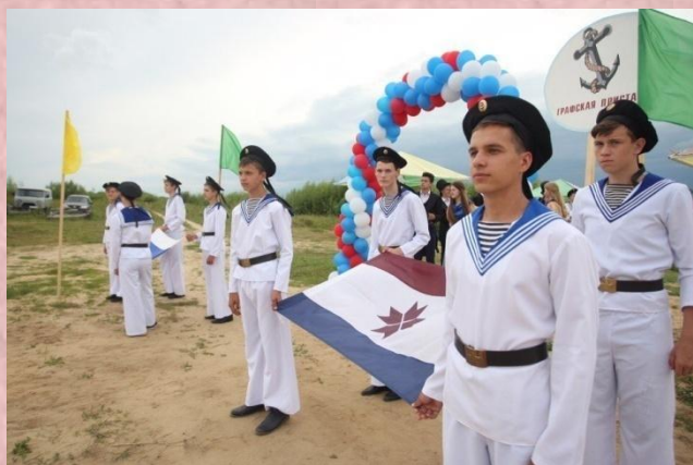
Межрегиональный фестиваль патриотической песни «МОРСКАЯ ДУША» г. Темников