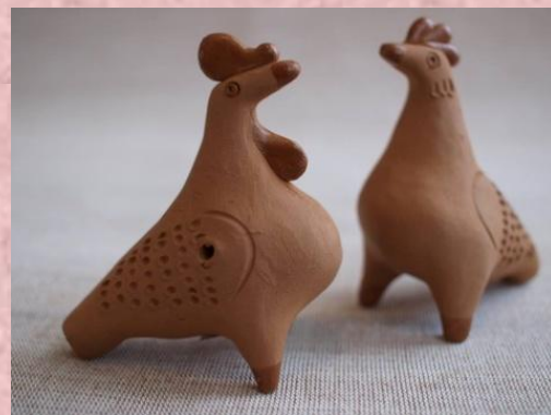
Праздник Шишкеевской глиняной игрушки Рузаевский р., с. Шишкеево