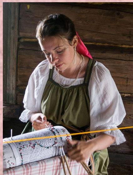
Районный праздник промыслов и ремесел «ТЕМНИКОВСКИЕ КРУЖЕВА» 22 сентября г. Темников