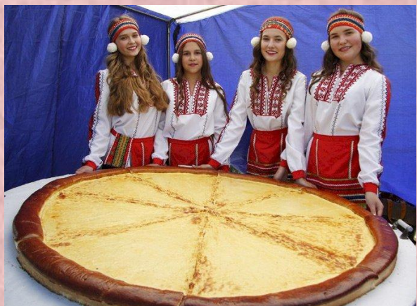
Межрегиональный фестиваль национальной культуры «КУРГОНЯ» Рузаевский район