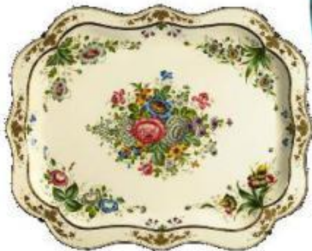
роспись с углов