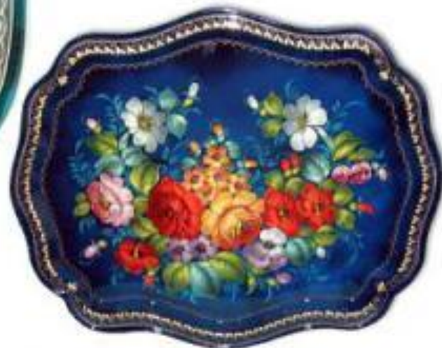
букет в раскидку