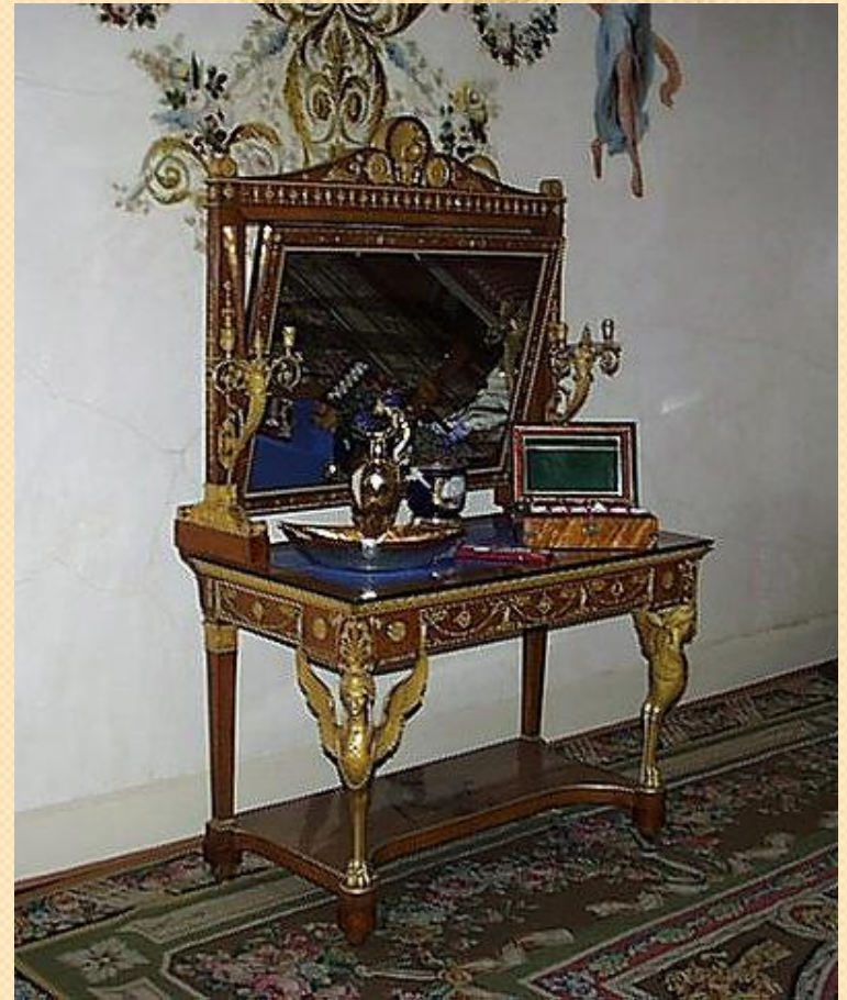
Туалетны стол з люстэркам «псише»