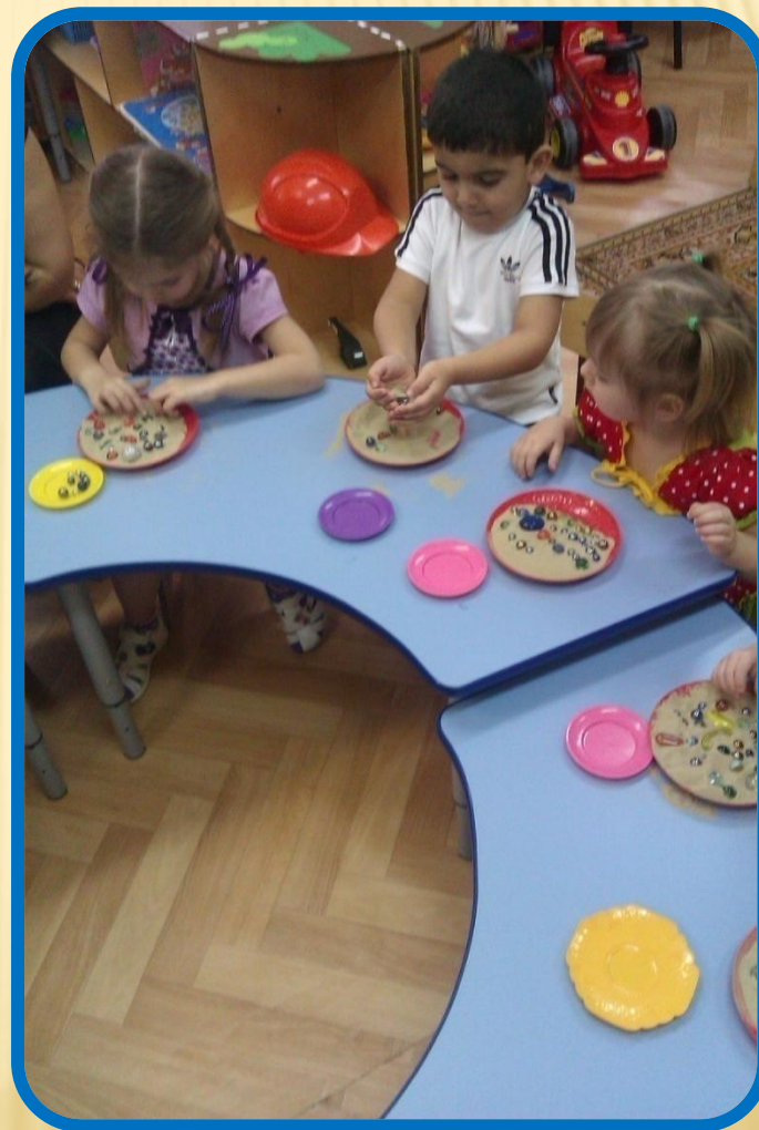
Занятия по адаптации детей к условиям ДОУ.