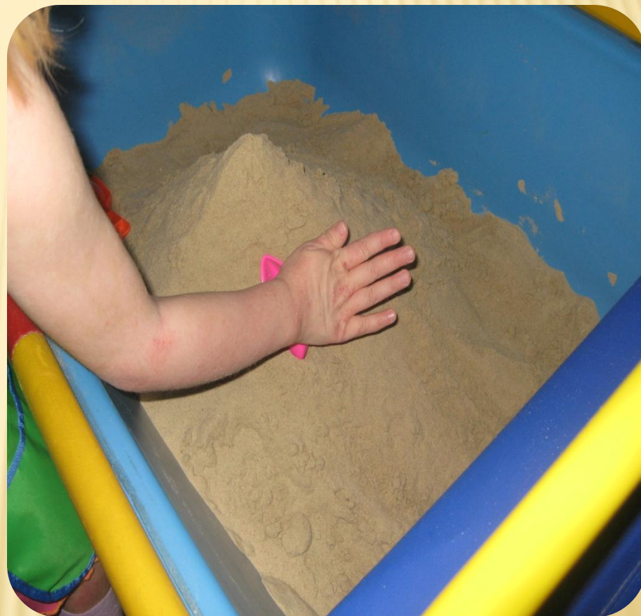
Вероника 4 года, нейродермит, скрытая форма агрессии.