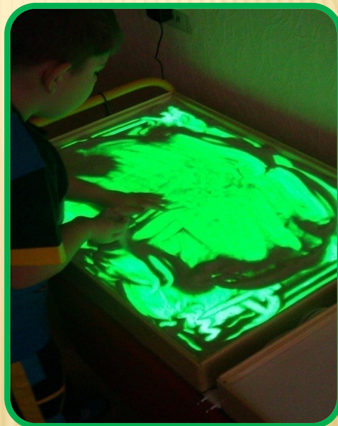
Дима, 6 лет, ОНР, ЗПР.