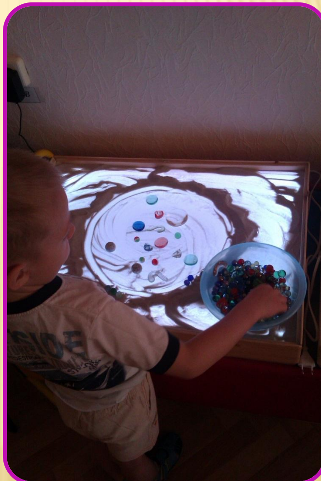
Построение песочной мандалы (агрессивное поведение).

Прекрасная и естественная среда для развития и обогащения сенсомоторного потенциала, которая в дальнейшем дает импульс развитию и формированию ВПФ, как внимание, мышление, пространственное восприятие, воображение, наблюдательность, зрительная и двигательная память, речь.