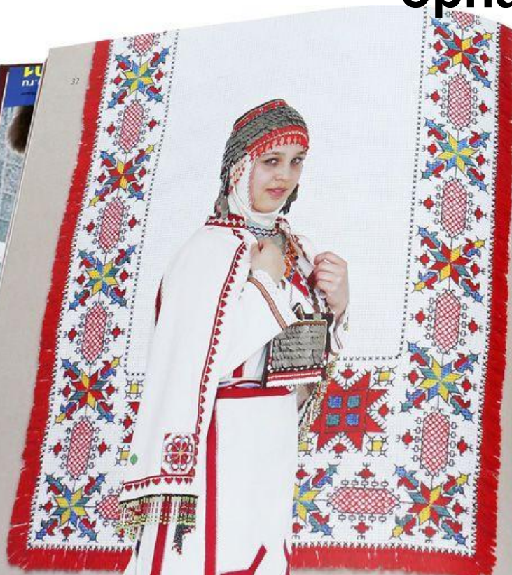
Женский костюм (рубаха, передник, сурпан, свадебное покрывало). 1985. Холст, вышивка, нашивки. Платок свадебный. 2012. Редина, вышивка, ленты. Платки свадебные. 2012. Редина, вышивка, ленты, бахрома.