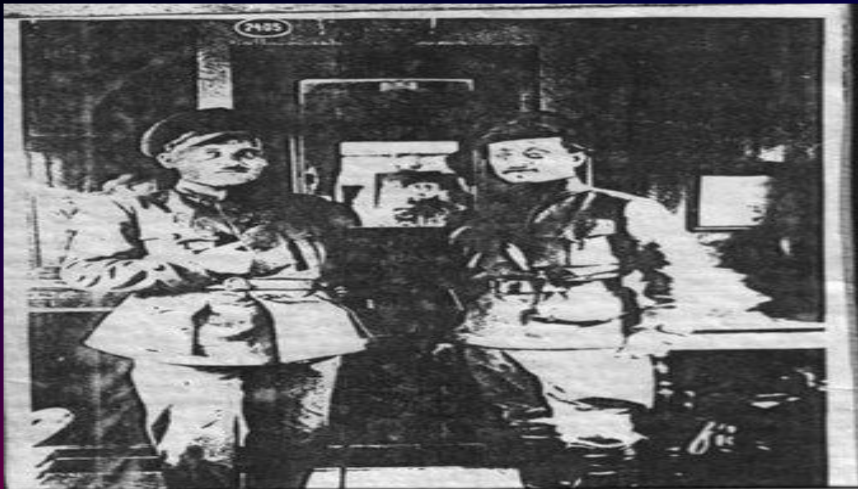
ГРИГОР'ЄВ (ЛІВОРУЧ) І АНТОНОВ- ОВСІЄНКО У ШТАБНОМУ ВАГОНІ НА СТ. ЗНАМ'ЯНКА. 1919 Р.