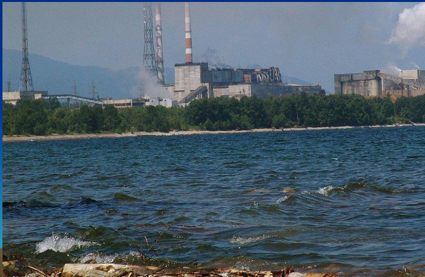
Отходы целлюлозно- бумажного комбината

Тема охраны окружающей среды всегда будет актуальна . Тем более , если это касается уникального природного наследия.