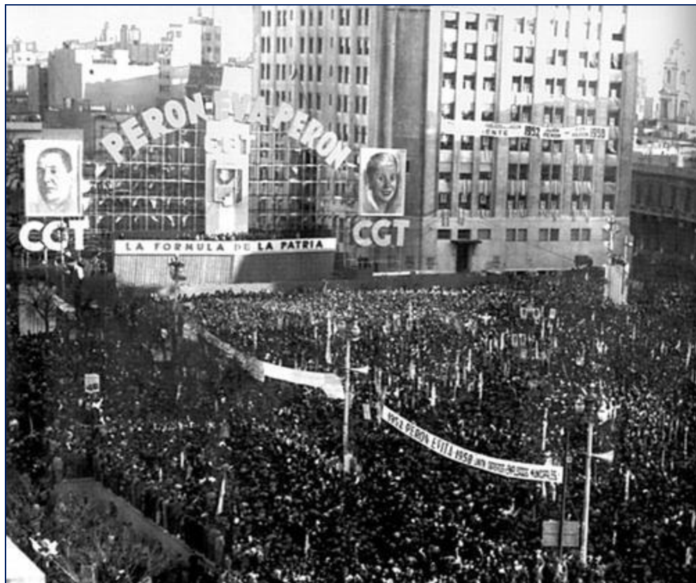
Диктатор Аргентины генерал Хуан Перон. 1946-1955 гг. 1973-1974