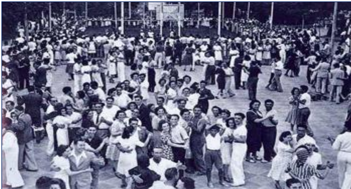
Праздник в честь свержения Перона в 1955 г.

Правительство Перона провело национализацию иностранной собственности, создало гос.сектор в экономике, принял трудовое законодательство, улучшило положение трудящихся. Огромное влияние в стране получает и его жена Эва Перон. При всех плюсах режима Перона, это была обычная хунта , характерная для Латинской Америки.