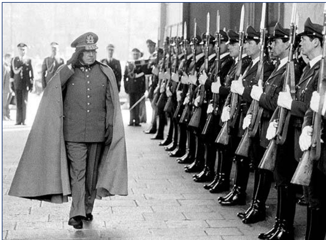
Диктатор Чили Аугусто Пиночет, 1973-1990 /1998/ гг.