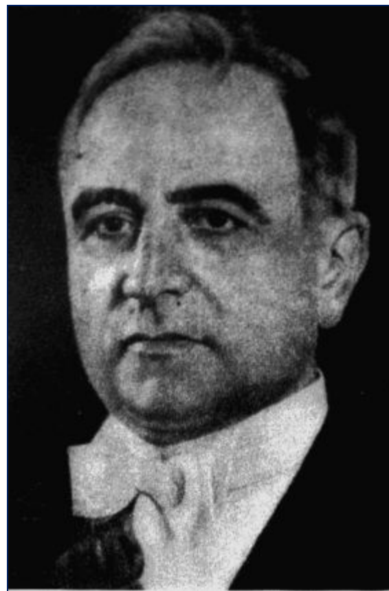
Ж.Варгас, президент Бразилии 1951-1954 гг.