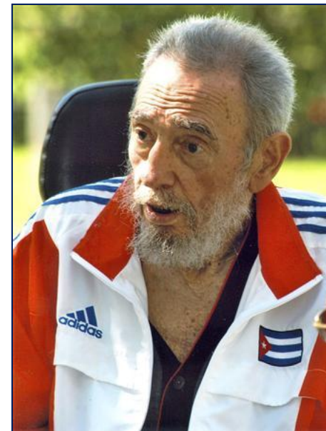
Современное фото Ф.Кастро.