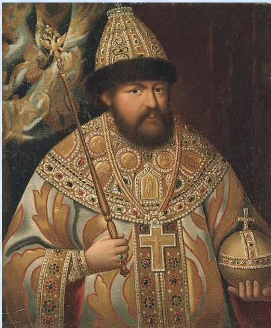
Алексей Михайлович, русский царь, отец Петра

Петр был младшим сыном царя Алексея Михайловича. Царь Алексей был женат два раза. От первого брака у него было 13 детей. Многие из них умерли ещё при жизни отца, и из сыновей только Федор и Иван его пережили, хотя и были оба серьезно болезненными. Царь был очень рад рождению сына.