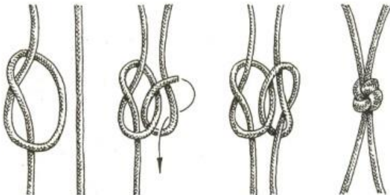
Схема плетения обыкновенного «любовного узла»