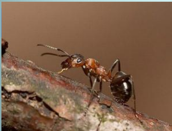
Муравей лесной Пчела