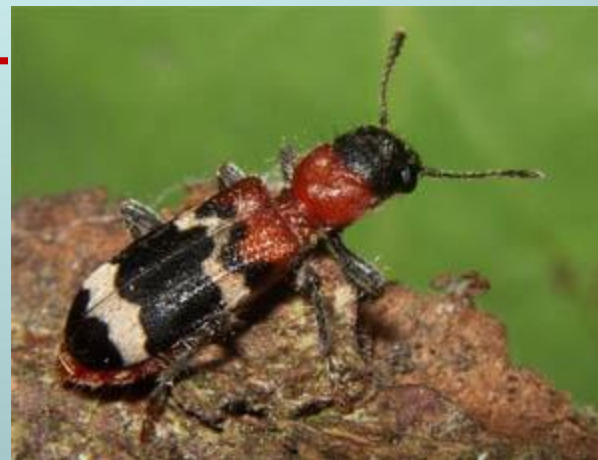
Муравье - жук