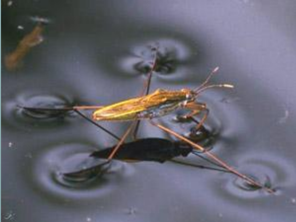
Водомерка Клоп- черепашка Гладыш