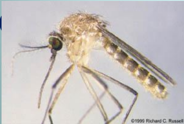
Комар – пискун Муха домовая