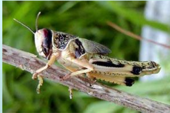
Саранча пустынная Сверчок домовой