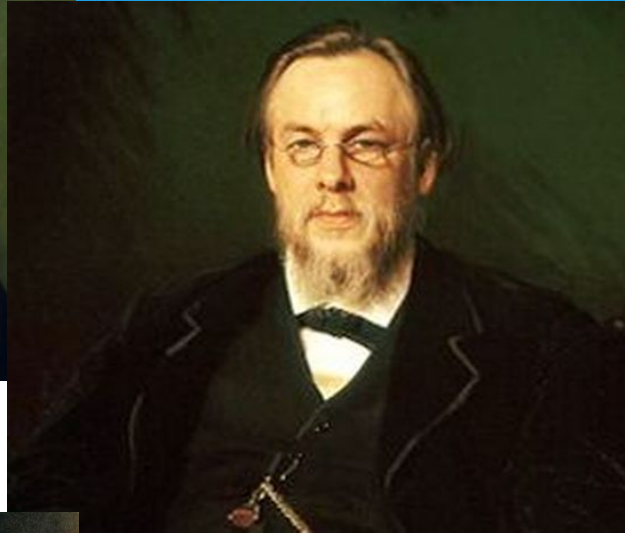
С. П. Боткин