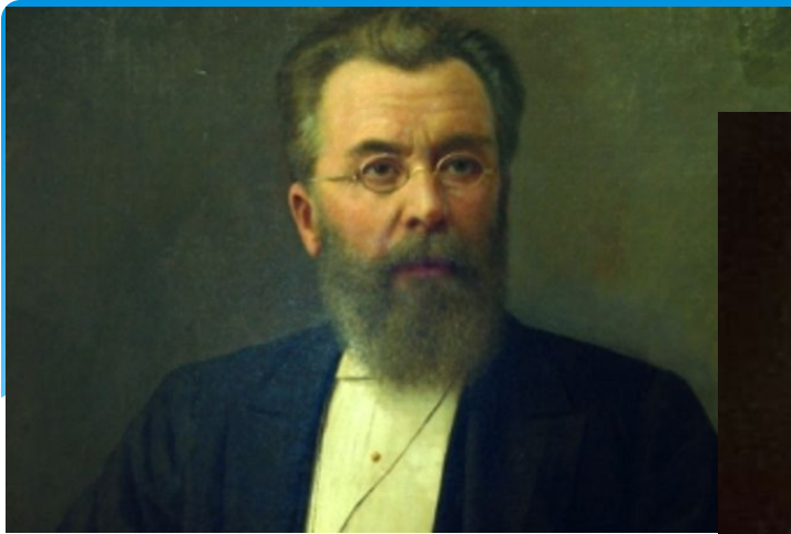
Н В Склифосовский