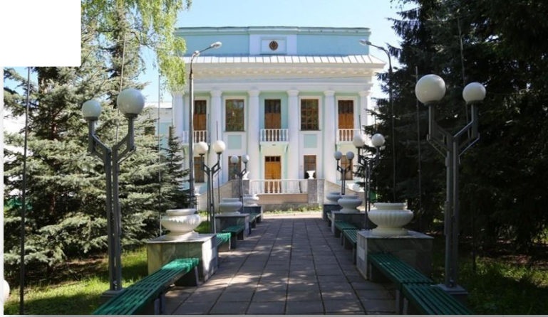
Корпус «А» Чувашского государственного университета им. И.Н. Ульянова.

В годы войны здесь размещалось управление 8-го телеграфного полка