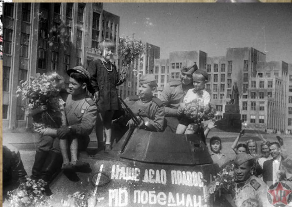
Советские солдаты в конце операции «Багратион»