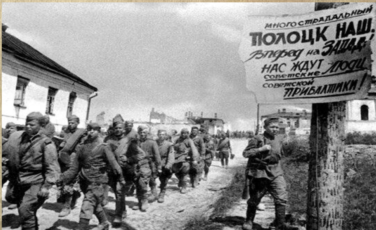
Советские воины на улицах освобожденного Полоцка