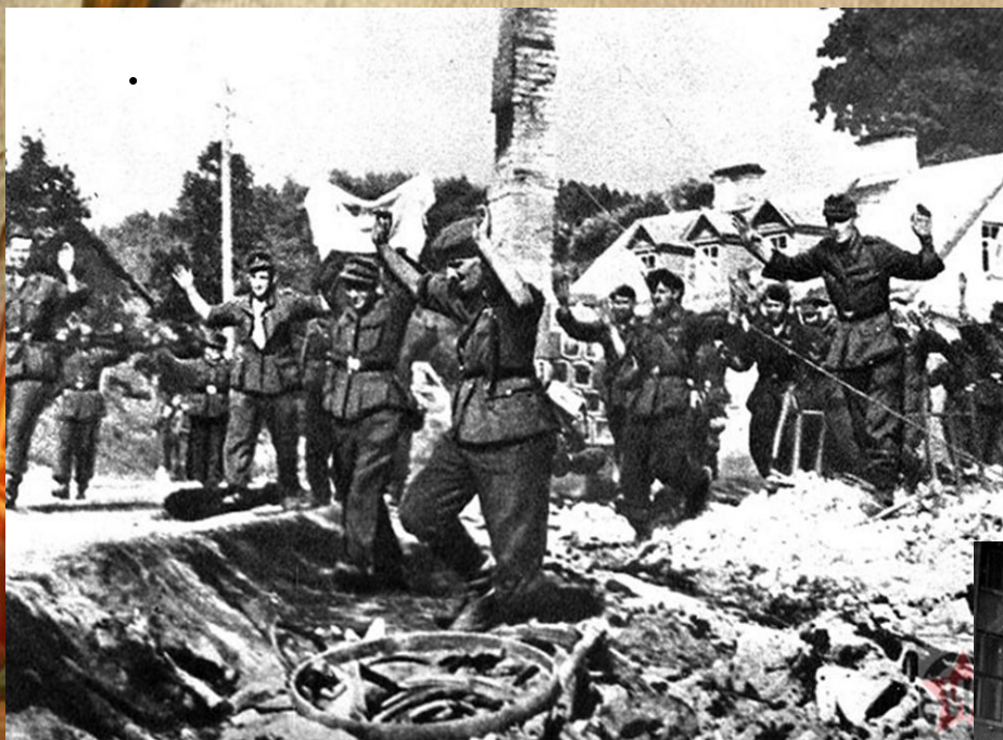
Немецкие солдаты в конце операции «Багратион»