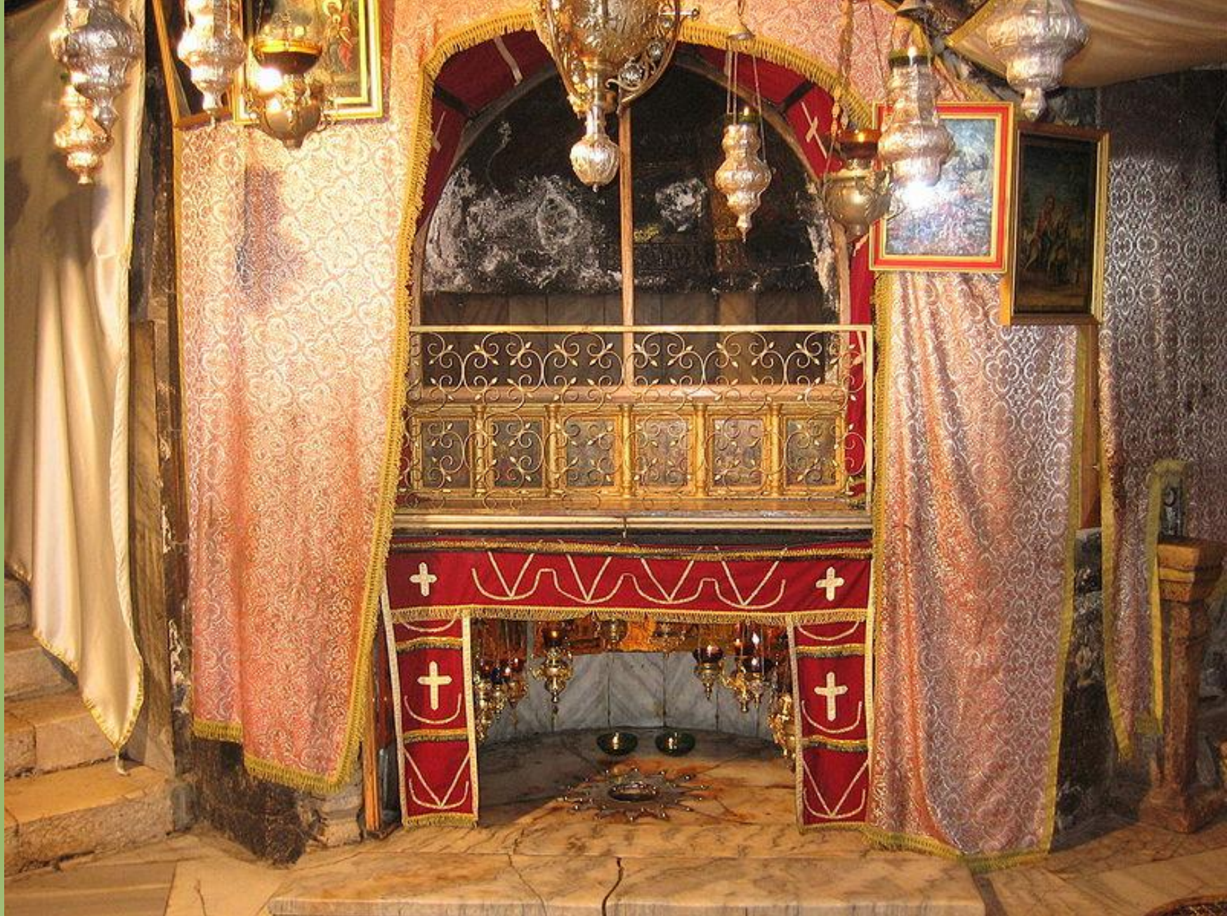
Святой престол над местом рождения Спасителя в Пещере Рождества Христова