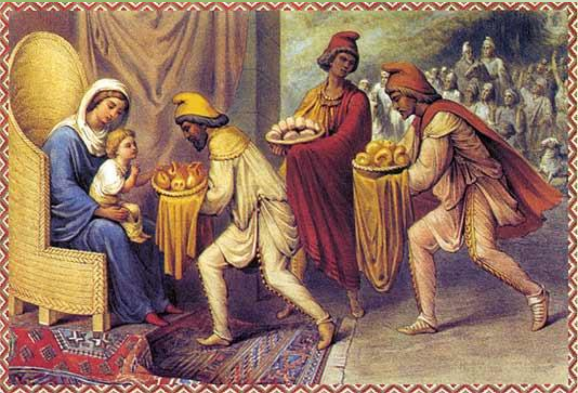
Григорий Гагарин. Поклонение волхвов