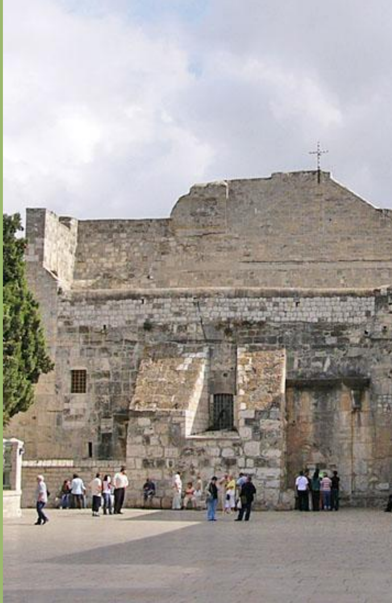
Храм Рождества Христова