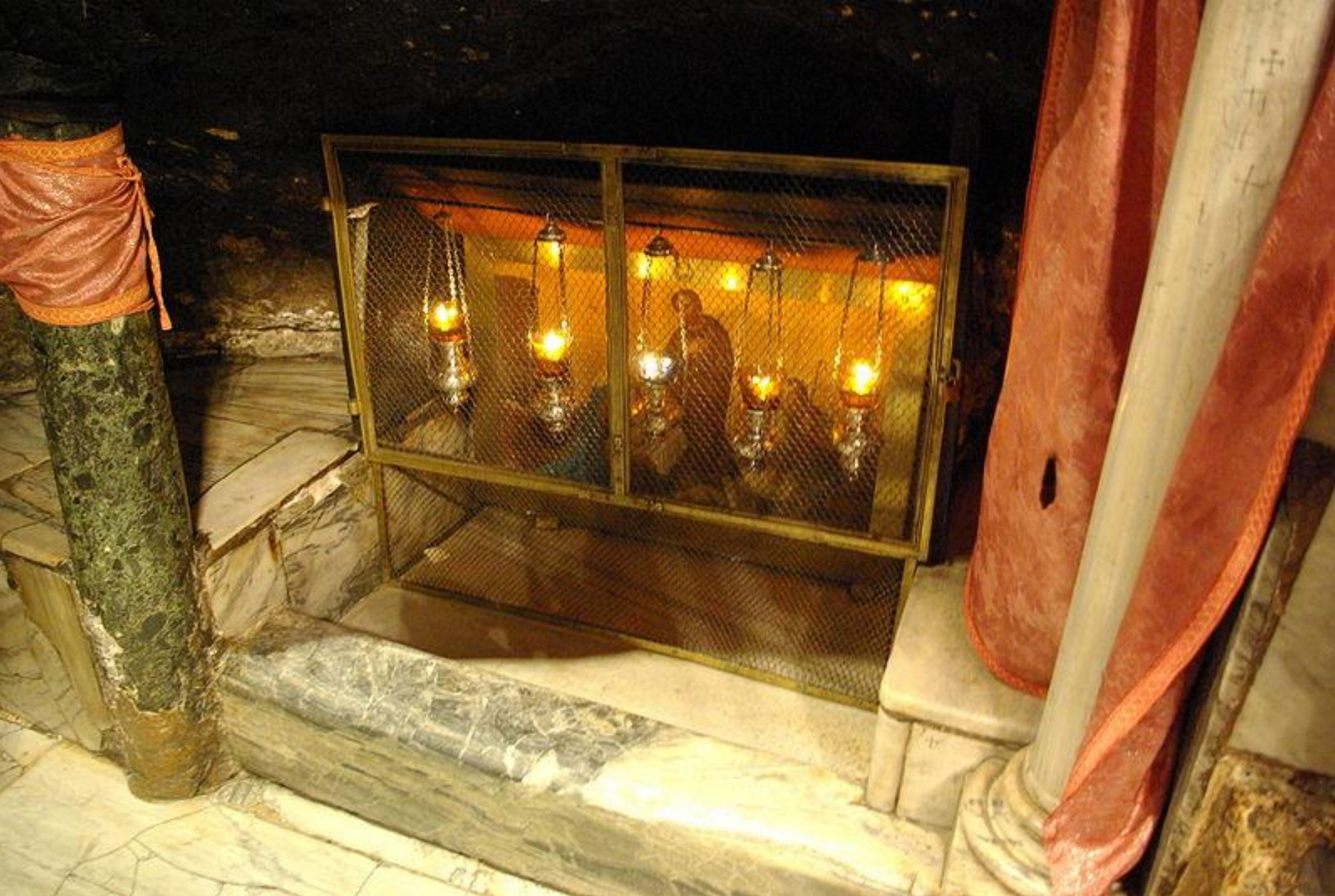
В южной части пещеры, слева от входа, расположен придел Яслей