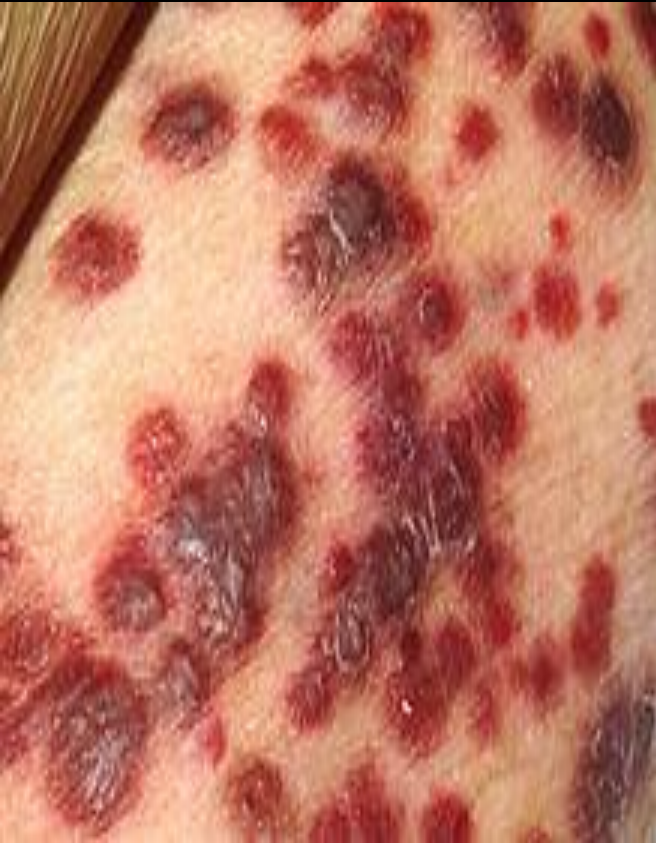
Опухоль Саркома Капоши