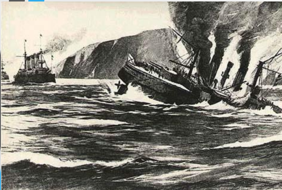
Гибель броненосца "Петропавловск" на японских минах

31 марта 1904 г. гибель главнокомандующего Тихоокеанским флотом С. О. Макарова