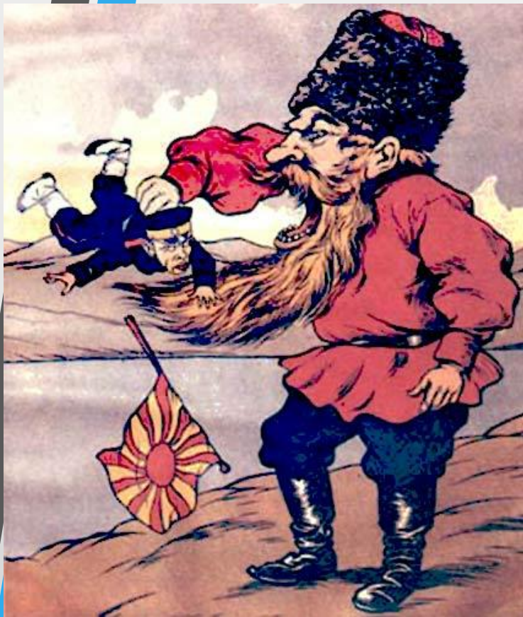
русский пропагандистский плакат 1904 г.