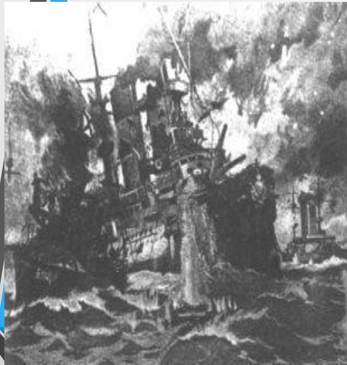
Сражение у острова Цусима

14 – 15 мая 1905 г. поражение 2-й Тихоокеанской эскадры под командованием Рождественского у острова Цусима