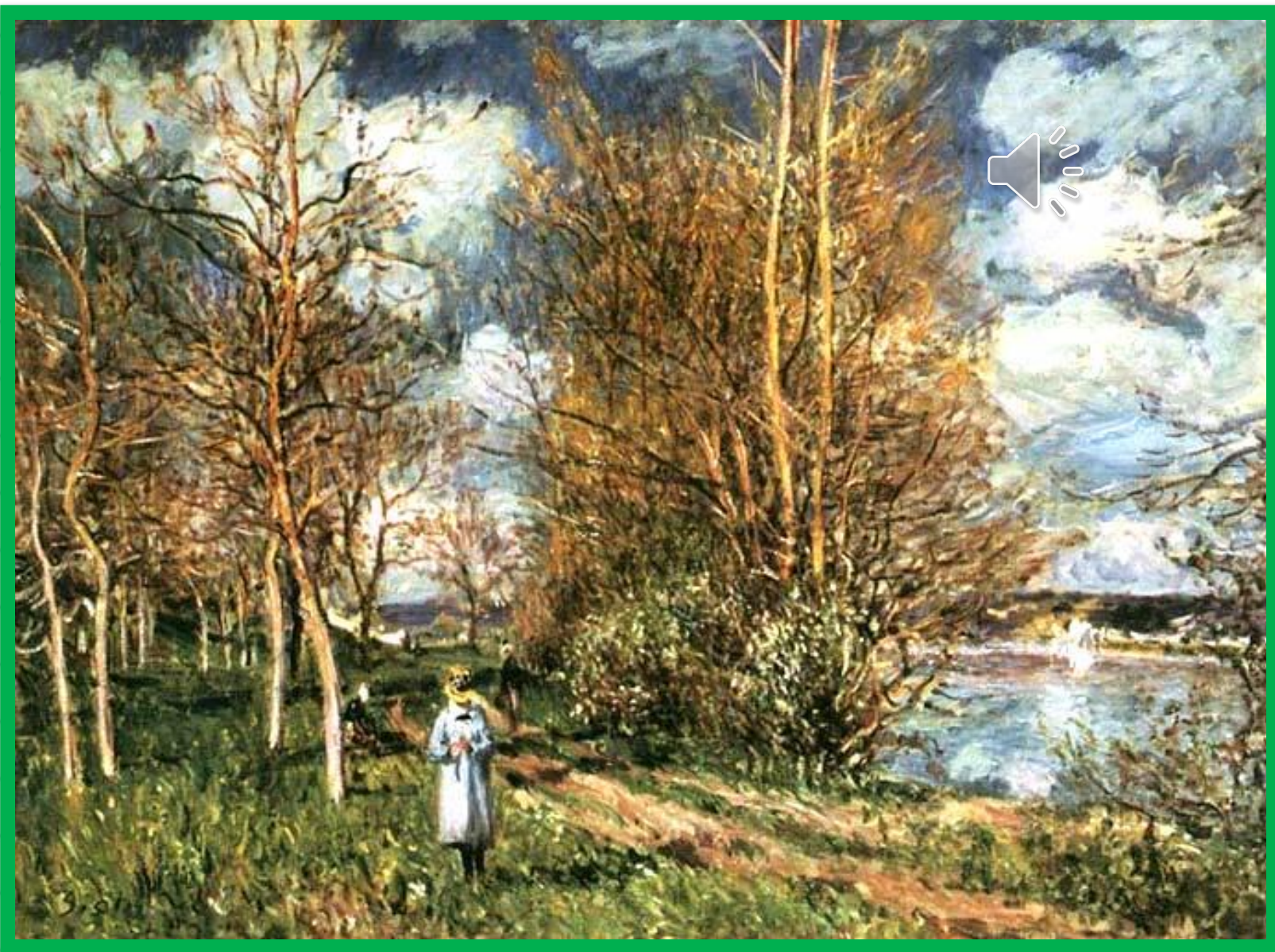
А. Сислей «Лужайка весной»