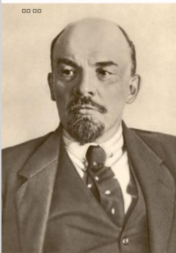
Ленин (Ульянов) Владимир Ильич (1870 - 1924)