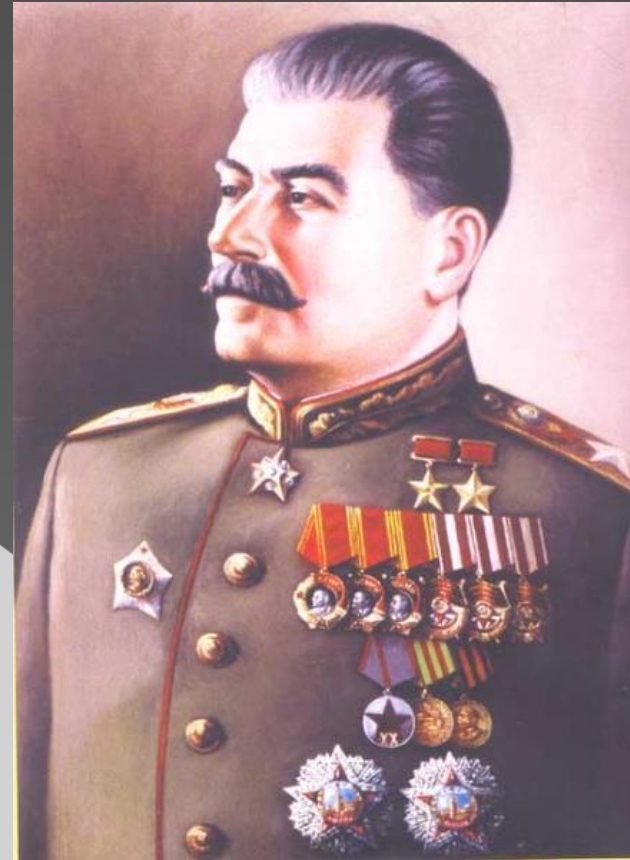
Сталин Иосиф Виссарионович (1879 - 1953)