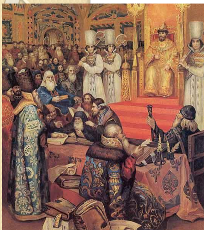
Соборное Уложение 1649г.