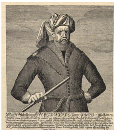
Восстание Степана Разина