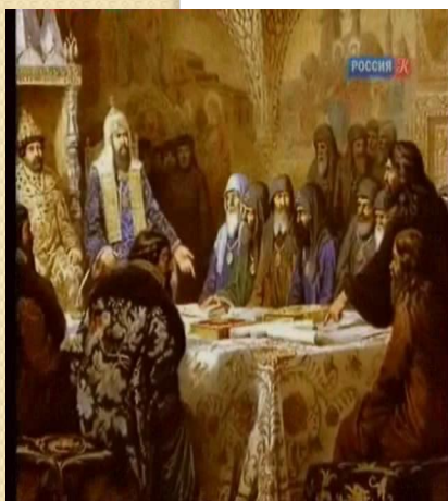
Церковная реформа Никона