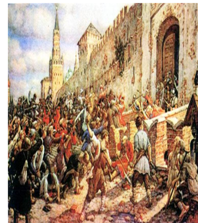
Соляной бунт 1648