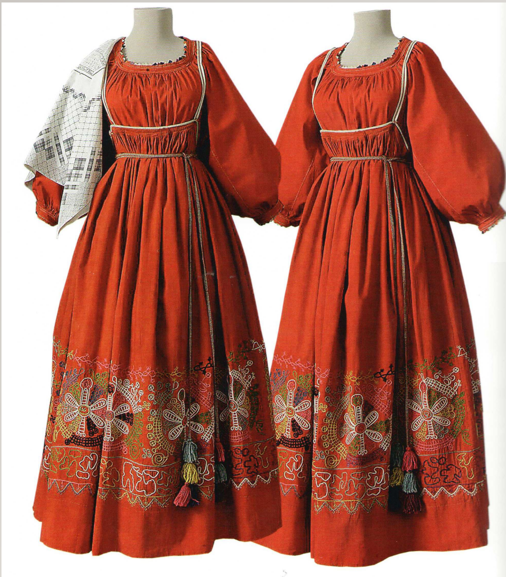
Слева Сарафан девичий «Кумачник» (девичий сенокосный костюм) Конец XIX века Олонецкая губерния