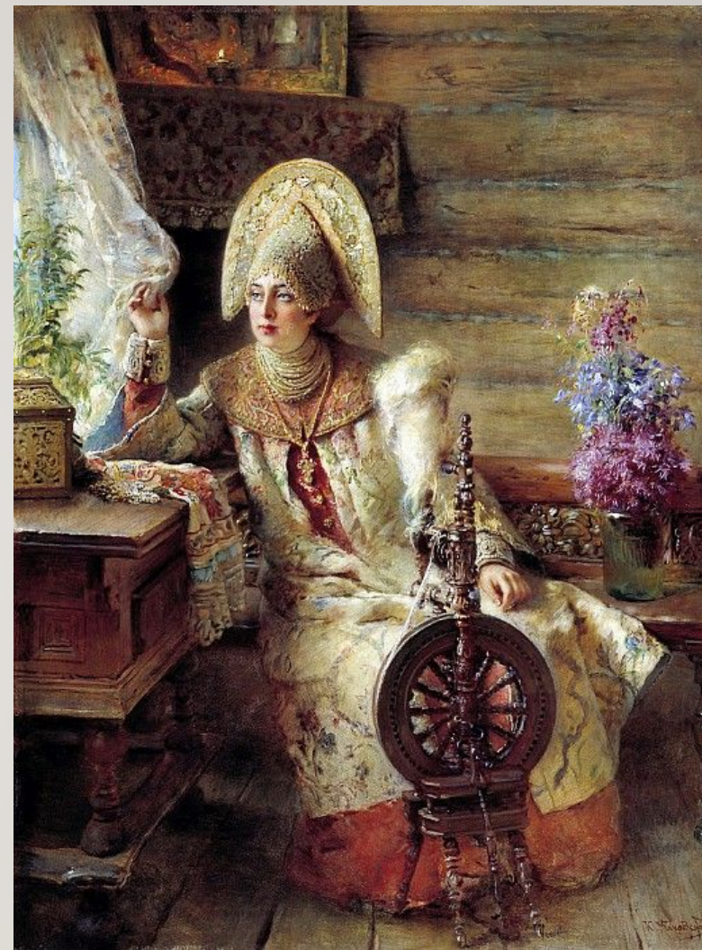
К. Е. Маковский «Боярышня у окна»