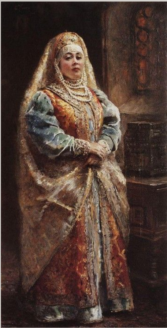
К. Е. Маковский «Портрет»