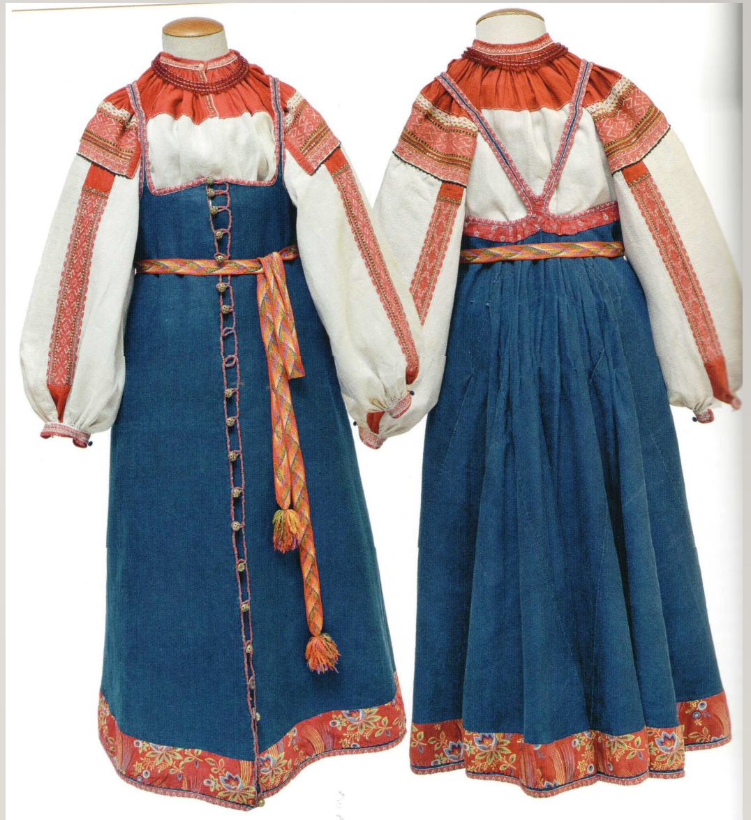
Справа на фото : Сарафан праздничный.

Вторая половина XIX века Тверская губерния