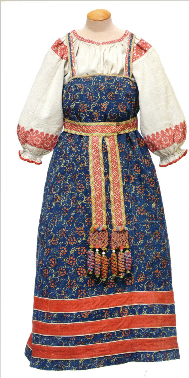
Слева на фото: Девичий праздничный костюм. 1910-е гг. Вологодская губерния.