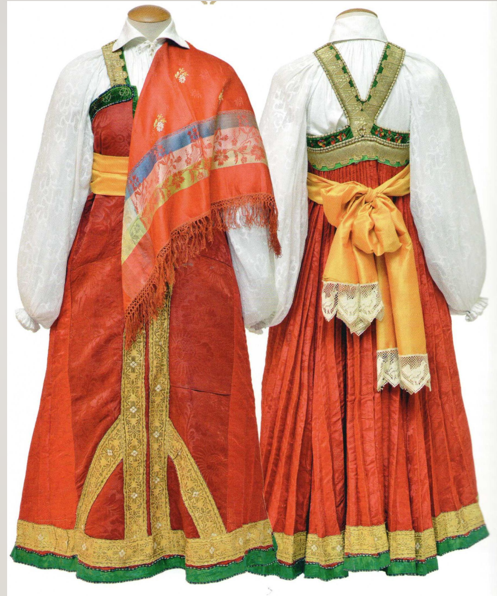
Справа Сарафан свадебный «Шубка» Начало XX века