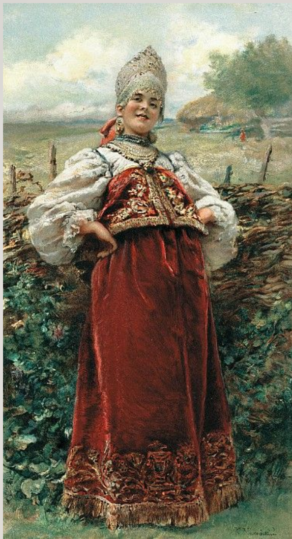
К. Е. Маковский «У околицы»