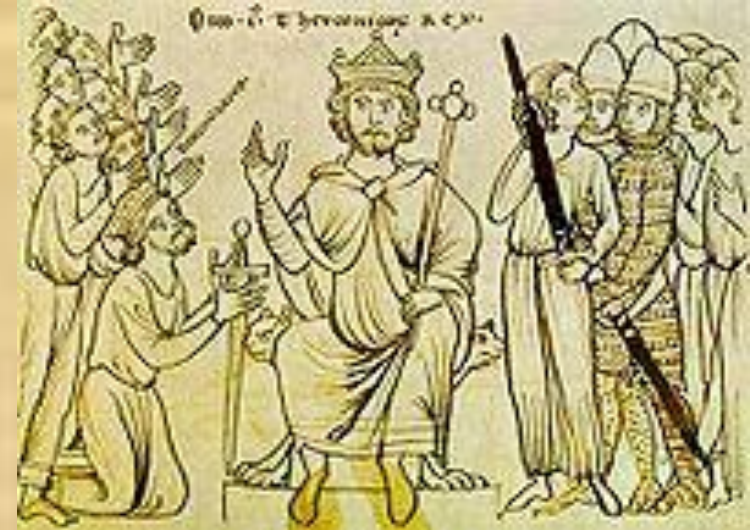
Оттон І (з Міланського рукопису, бл. 1200 )

Брата свого Бруно він поставив архієпископом кельнським. Він правив суворо, але справедливо, тримав васалів у покорі, зробив свій блискучий двір центром держави, збільшив майно корони і зумів знайти опору в духовенстві. У 950 р. йому вдалося знову підпорядкувати собі вендів і чехів; в 947 р. здійснив переможний похід проти данців.