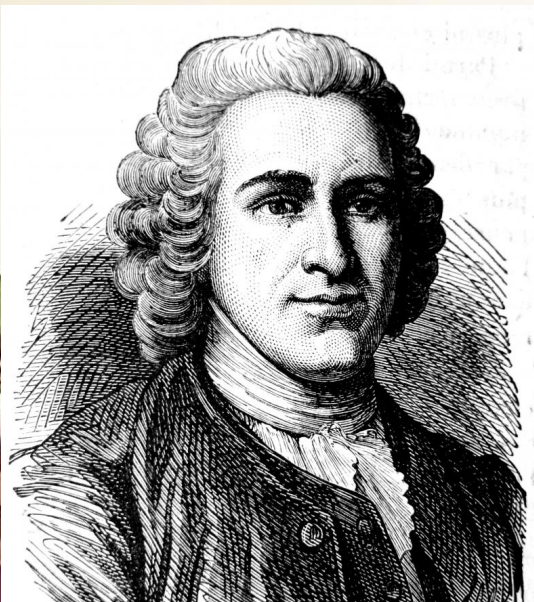
• Жан-Жак Руссо