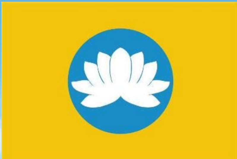
Флаг Республики Калмыкия