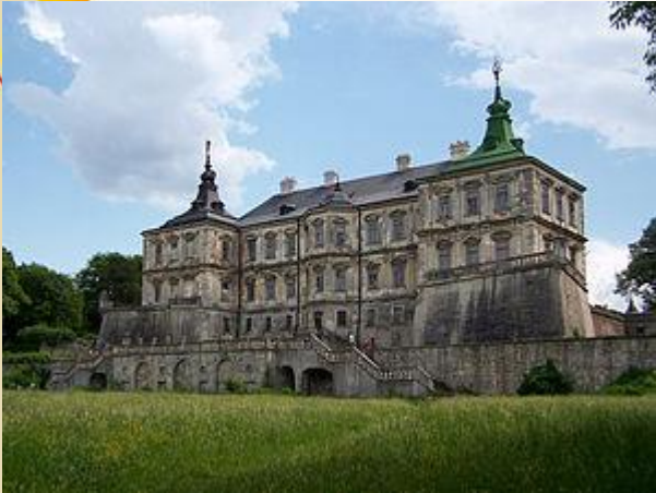
Італійський парк (Підгірці)