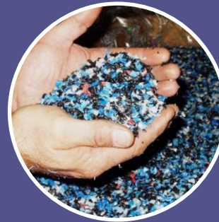
Вторинне використання відходів