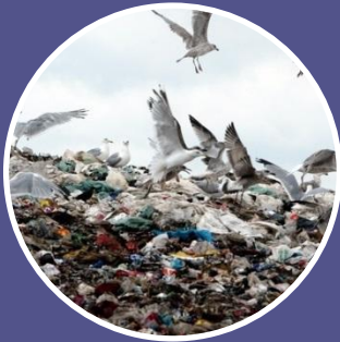
Поховання на смітниках