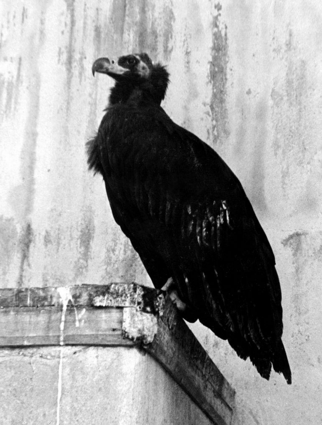
Черный гриф Верочка