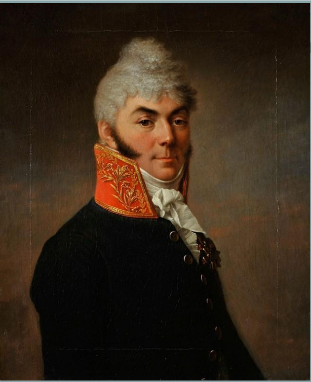
Н. Н. Новосильцев

Николай Николаевич Новосильцев, талантливый дипломат и государственный деятель, ему Александр поручил разработку конституционного проекта.