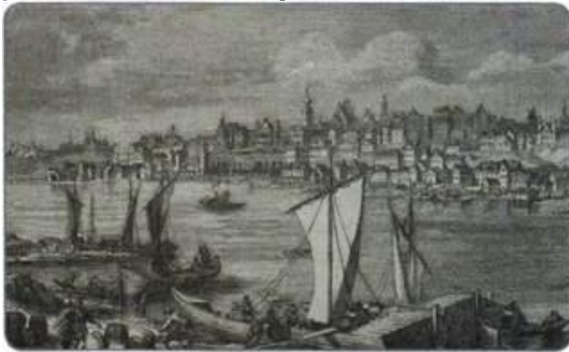
Варшава. Гравюра XIX в.