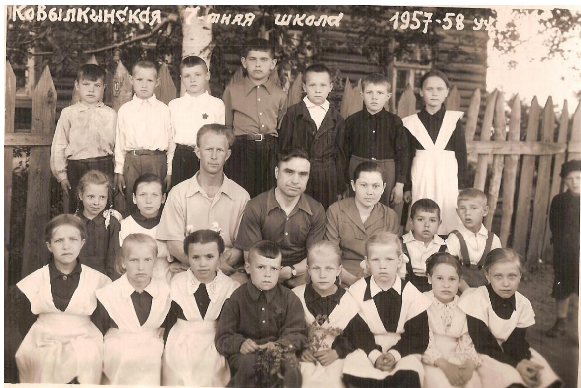
В. С. Соловьев со своими учениками