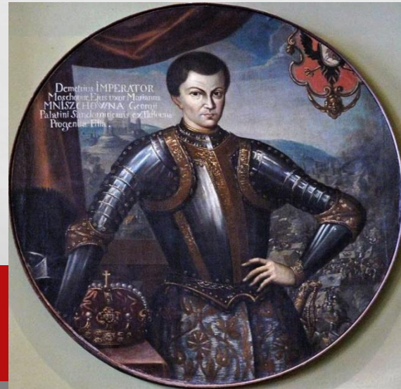
Григорий Отрепьев – он же Лжедмитрий 1