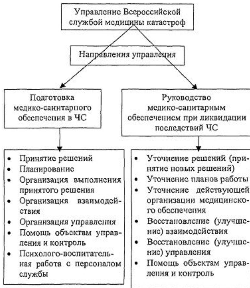
Рис. 39. Содержание управления Всероссийской службой медицины катастроф.