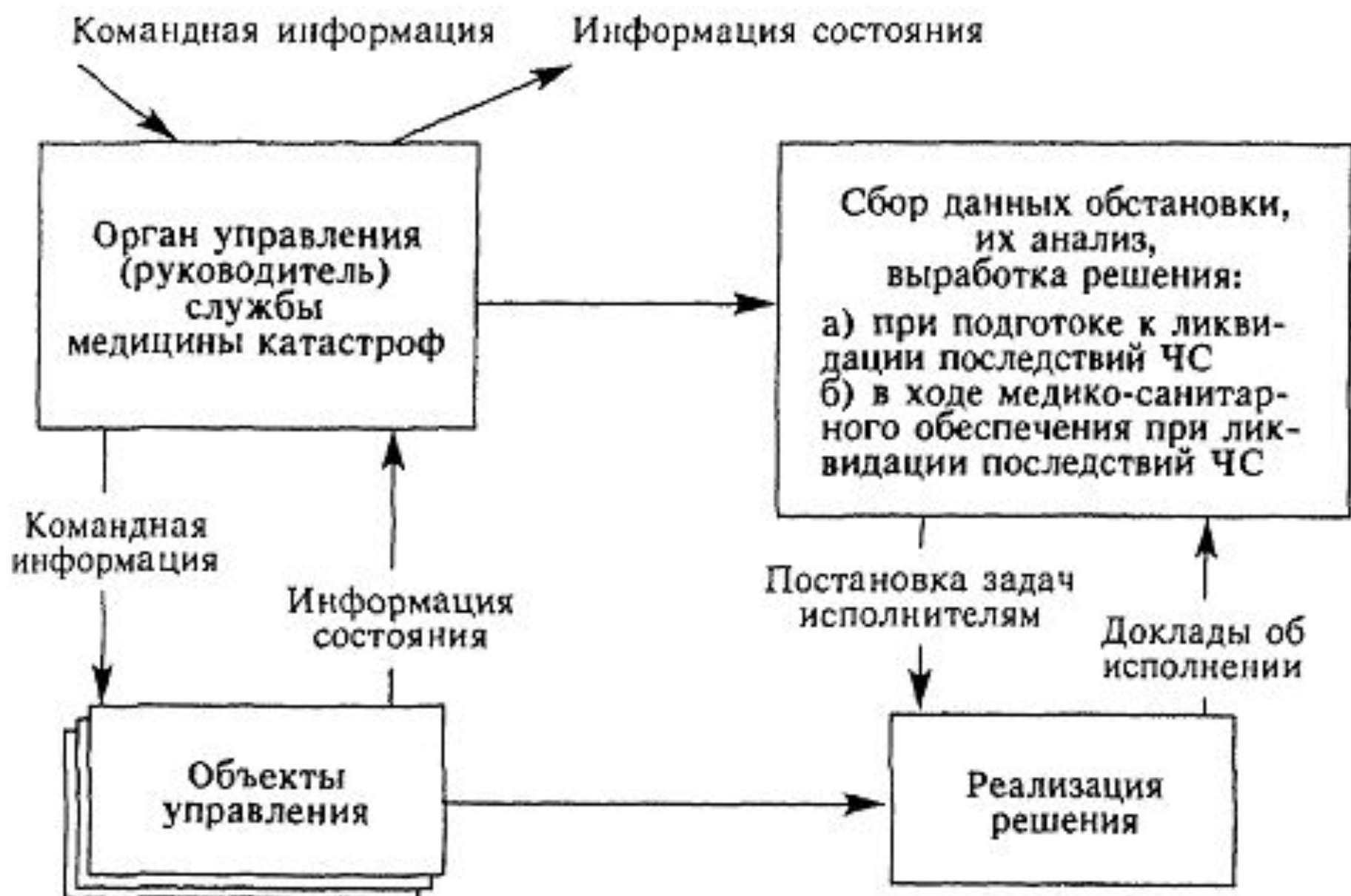
Рис. 38. Принципиальная схема управления службой медицины катастроф.